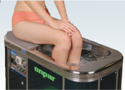
足関節治療に最適