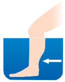
「承山」付近を直接刺激